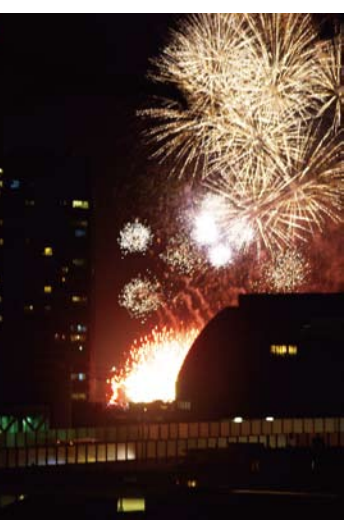
写真は、昨年10月1日に開催された「川崎市制記念花火大会」に浮かぶ二子玉川ライズS.Cとライスタワー&レジデンス。

希望~みんなで支え合い輝く未来へ~ 実施日:平成24年8月18日(土) 19:00~20:00 ※荒天の場合は翌19日(日) 19:00~20:00 順延 会場:世田谷区立二子玉川緑地運動場 主催:世田谷区たまがわ花火大会実行委員会、世田谷区