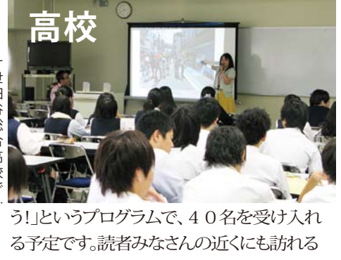
世田谷総合高校「プロジェクト」の紹介をする構想写真。

二子玉川商店街や組合員の商売が、地域学校機関の社会教育の現場として活躍しています。世田谷総合高校(岡本2-9-1)では、「奉仕体験活動」の授業で、地域の8団体の協力を得て、240名生徒たちが11月9日まで20時間にわたって学習します(うち、各団体での体験活動は10時間)。二子玉川商店街でも「商店街の『すてき』」を伝えよう!というプログラムで、40名を受け入れる予定です。読者みなさんの近くにも訪れる