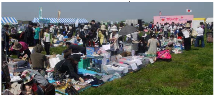
天気にも恵まれ、賑わう会場

4月29日(祝)、2年ぶりとなる花みず木フェスティバルが兵庫島河川公園をメイン会場として開催されました。今年は30周年の記念となる開催で、アート&マートともジョイントし、街全体での賑わいとなりました。(▼3面関連記事)