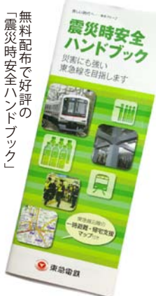
「無料配布で好評の震災時安全ハンドブック」

とを目的に発行しているものです。震災発生時に利用者に協力してもらいたいこと、大規模地震に備えた東急線の取り組み、東急線沿線の駅周辺地図を一冊にまとめた構成。駅周辺地図では、大規模地震発生時、列車の運行が再開するまでの間の一時滞在施設や広域避難場所を東急線沿線を37エリアに区分けして表記しています。